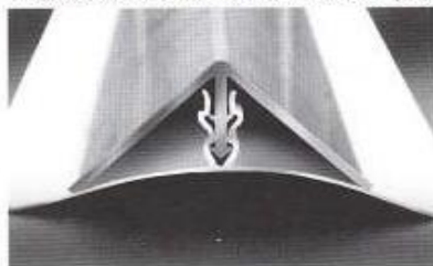
ΥΓΕΙΟΝΟΜΙΚΗ ΓΩΝΙΑ - SANITARY ANGLE (PVC)